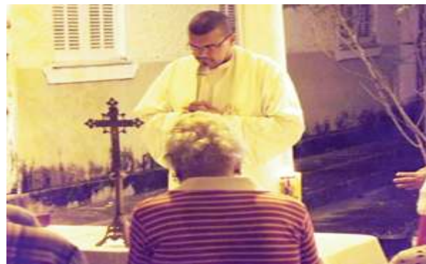
Missa na Vila