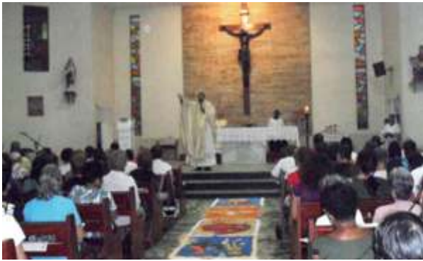
Missa - Corpus Christi