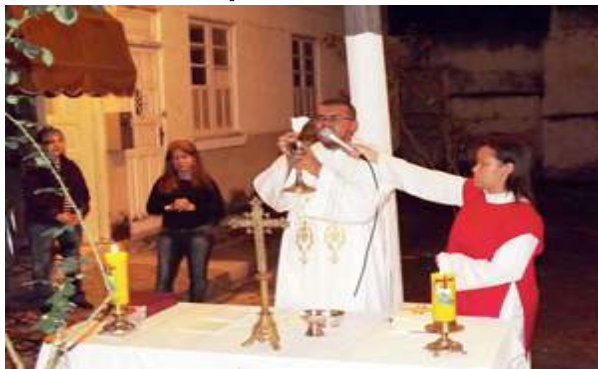
Missa na Vila