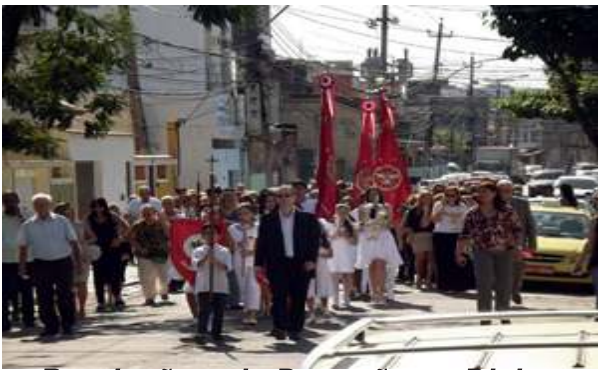
Procissão pela Devoção ao Divino Espírito Santo