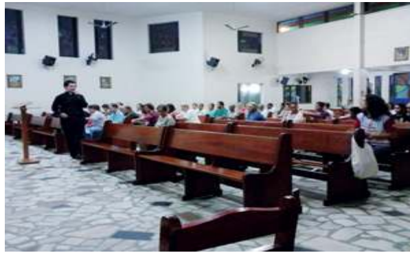
Seminário Cura pela Palavra