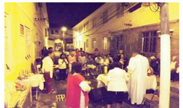
Missa na Vila