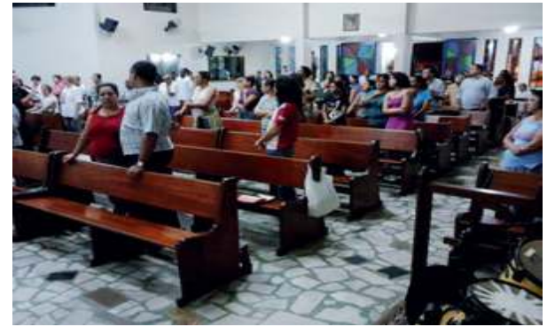
Seminário Cura pela Palavra